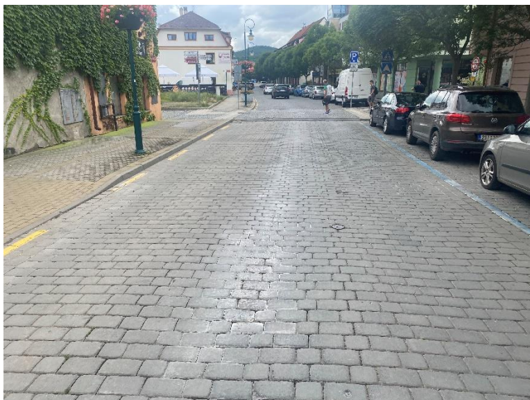
Foto 5: Konec opravovaného úseku (napojení na zvýšený práh ze žulových kostek)