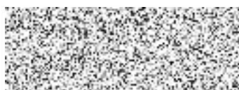
FIN-servis, a.s. Dohodce