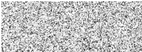
Jiří Fiala na základě plné moci