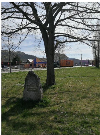
památný kámen u Lípy svobody