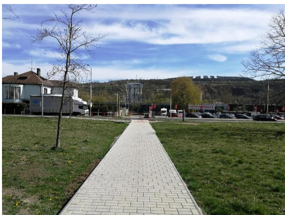
centrální chodník spojující budovu Střední zdravotnické školy a Plzeňskou ulici