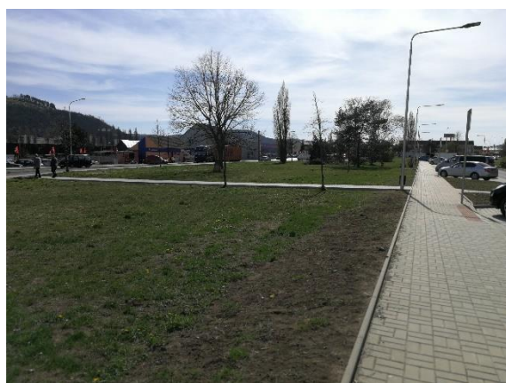
trávnicková plocha bez výsadeb ve východní části území