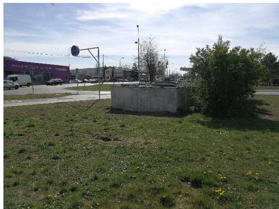
objekt tepelného výměníku