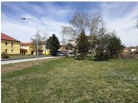
stávající keřové výsadby v trávnickové ploše