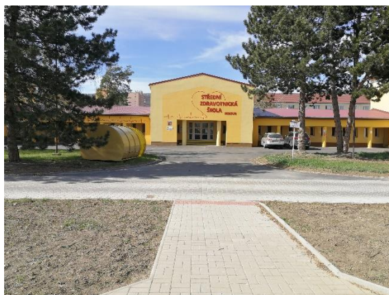
pohled k budově zdravotní školy