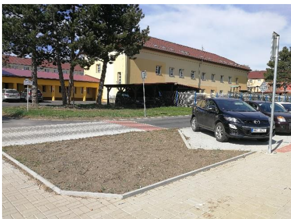
nově vzniklý ostrůvek u přechodu přes ulici Mládeže