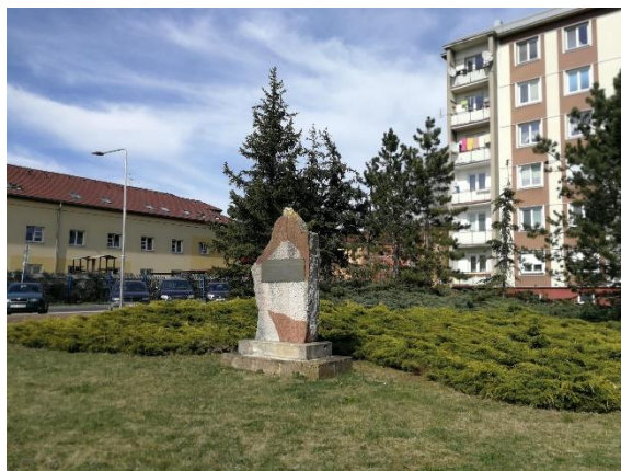
pohled na stávající úpravu u pomníku Josefa Moláka