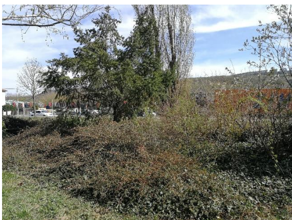
Některé keřové skupiny jsou dožívající