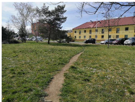
stávající živelná stezka mezi ulicí Plzeňská a Mládeže