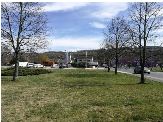
prostor na západní straně zdravotní školy, kde vzniknou nová odpočinková místa